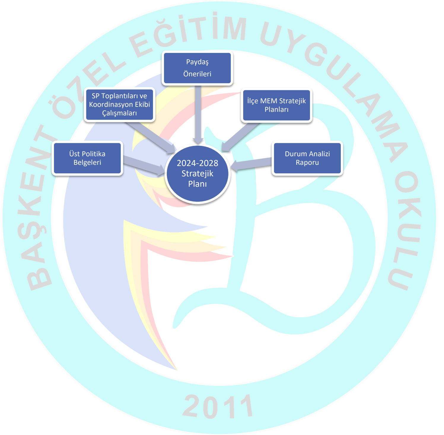
Plan oluřum řeması Őekil-1